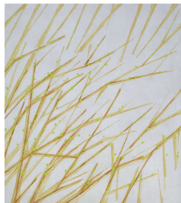
Branches, Egg tempera and oil on linen 189 x 168 cm.

> Tentoonstellingen o.a.: De Pont museum Tilburg, Dordrechts Museum, Galerie Onrust Amsterdam, Peter Blum Galerie New York, Galerie Knoell Basel