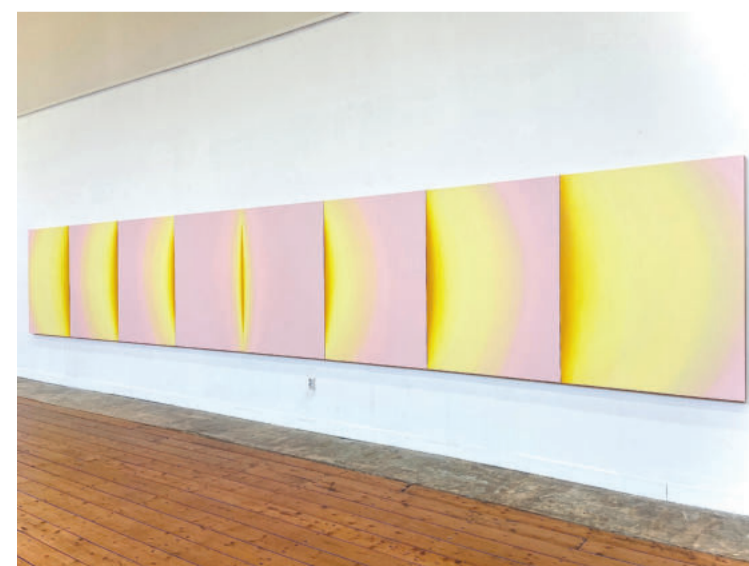
Esther Tielemans, Sun 2024. Acryl op houten panelen 152 x 920 cm

> Recente tentoonstellingen: Boijmans van Beuningen (2024), Rotterdam, Fondation CAB, st Paul-de-Vence (2024), Museum Voorlinden Wassenaar (2024), Singer museum Laren (2023), Kröller-Müller Museum, Otterlo (2022), Kunstmuseum Den Haag (2022)