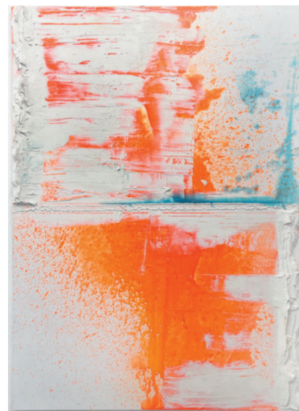
Rave 2021 Pigments, acrylicmedium, oilpaintmedium on canvas 250 x 175 x 8 cm

> Tentoonstellingen o.a.: Van Horn Düsseldorf, art Basel Hong Kong, Fox Jensen McCrory Auckland, De Pont Tilburg, De Vleeshal Middelburg, Gerhard Hofland Amsterdam.