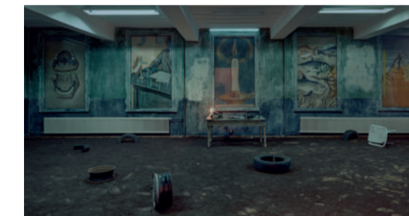
"There were no noises outside. There was no shadow on the wall" Mixed media variable dimensions. Installation picture from Marres' "Opaque Spirits" show. 2024.

cartografie van de ruggengraat van de staat, inclusief de gezondheidszorg- en onderwijsadministratie; en hun relatie met de media en de populaire cultuur.